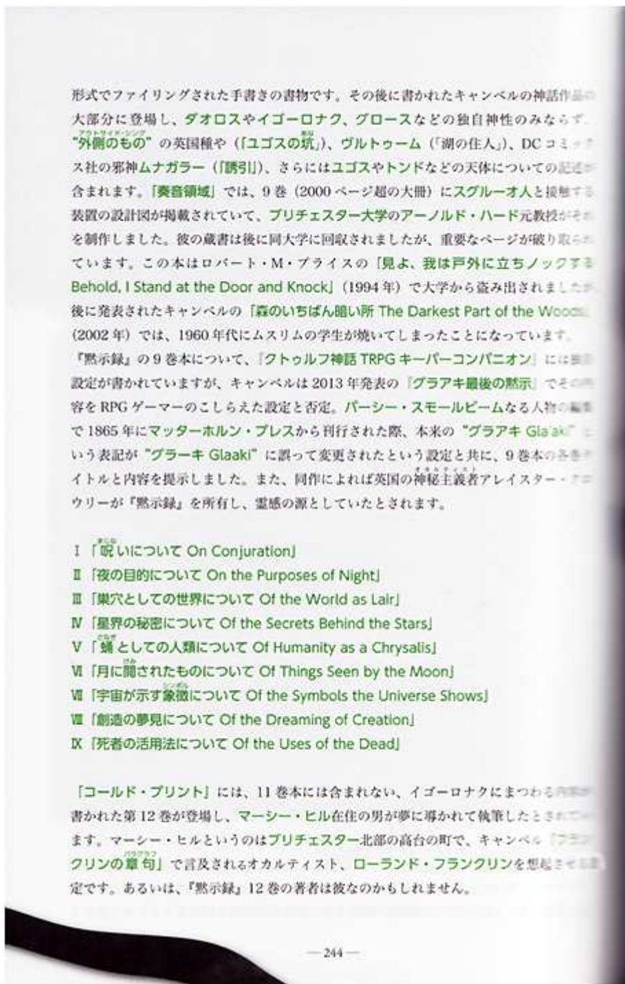
第 11 巻のタイトルにまつわる記述は誤謬につき削除